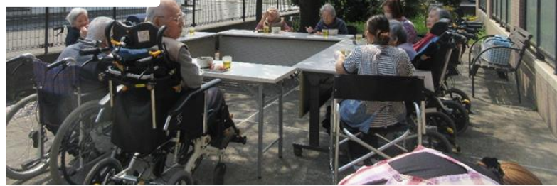
写真左上と中央：デイサービスセンター「お花見」

お花見&お稲荷さん作り…4月は中の郷の桜でお花見を行いました。満開の桜を眺めながら歌を歌ったり、おしゃべりをしたり楽しみました。「お稲荷さん作り」も行いました。ご自分で作り、おやつに美味しく頂きました。