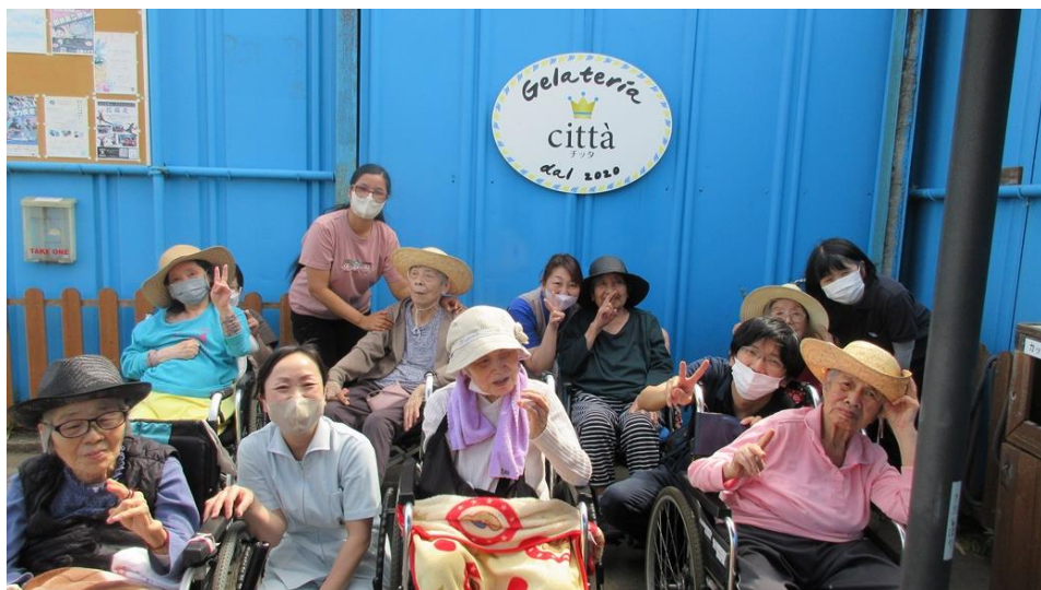
写真上：特養従来ジェラート食べに行きました！

5月 入居者様と近くのジェラート屋さん「チッタ」へ出掛けてきました。初夏の陽気で外出するにもアイスを食べるにも最高の日取りでした。好みの味を2種類選び、食べ比べしながら笑顔で皆さん美味しく召し上がられています。人気の組み合わせは濃厚ミルクとピスタチオでした！！