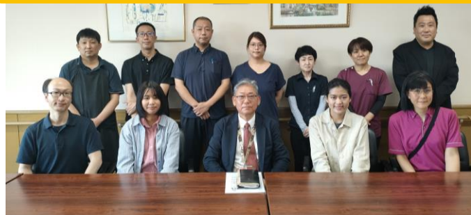
特養従来と特養ユニットに配属となります、よろしくお願いたします（前列右から2と4番目）