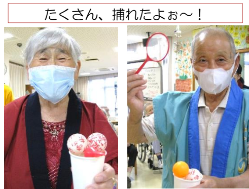
笑顔 笑顔のゲームでした。

昼食に松花堂弁当を召し上がっていただきました。いつまでもお元気で来所をお待ちしています。