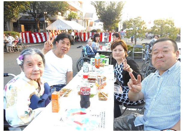
納涼祭（特養ユニット） 夕浴衣姿も素敵でしょ！

3階ベランダで夕涼み会を行いました。ビールにシユース、焼き鳥、枝豆、たこ焼、ウィンナー、味噌田楽、いなりの寿司、ピザ、そつめんを用意し、職員も浴衣姿で暑気払いしました。次は家族様と一緒に楽しめたらと思います。