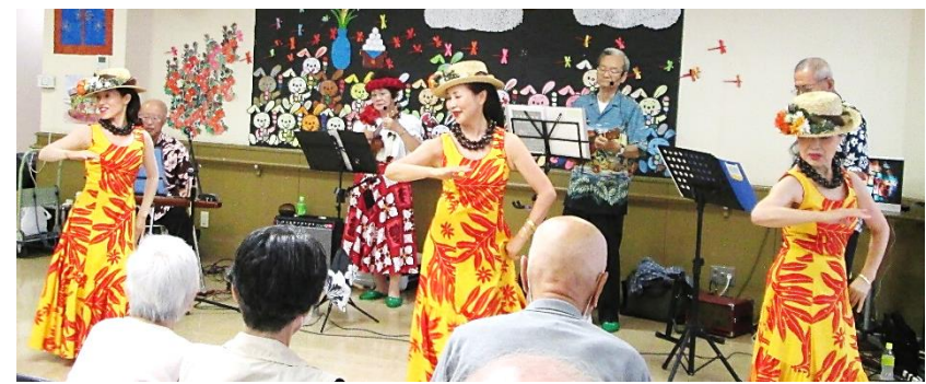
敬老会（デイサービスセンター）ハワイアン様による演奏と踊り多くのボランティア様のご協力の下、楽しい敬老会が行えました。高峯会様（日舞）、青い山脈様（劇）ほか皆様有難うございました。