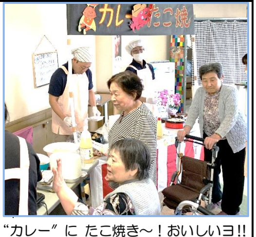
“カレー”に たこ焼き～！おいしいヨ！！