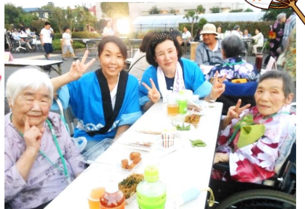
家族様と一緒に楽しい時間を過ごしました。