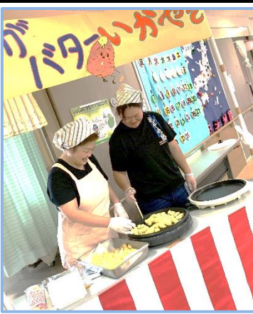
じゃがバターはいかがあ～！