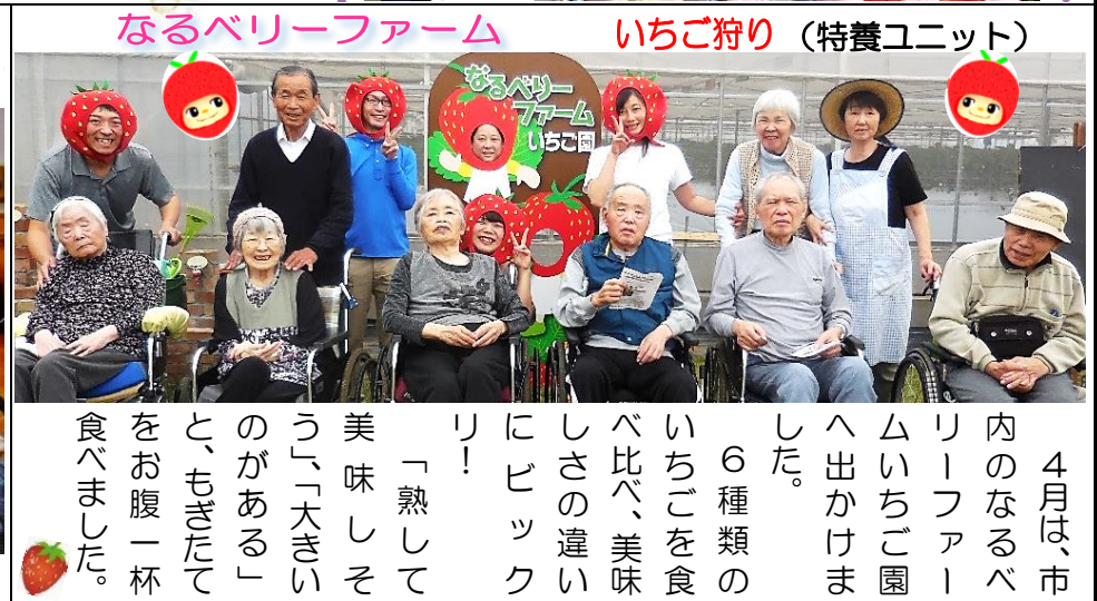
なるベリーファーム いちご狩り（特養ユニット）

5月は、「パーベキュー」をします。もも合同で行いました。シウウシウウと焼ける匂いが立ち込め、食欲は刺激され、「美味しい!!」声と、笑顔のあふれる食事レクでした。もちろん、皆さん、普段よりも多く召し上がられました。