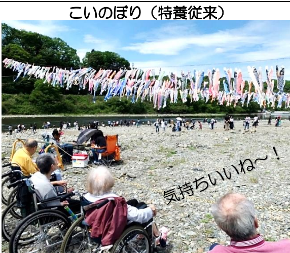
こいのぼり（特養従来）

5月1日は、皆さんと高田橋まで行ってきました。清々しい五月晴れの河原に座ってこいのぼりと一緒に風を感じ、皆さんと楽しくおしゃべりしました。