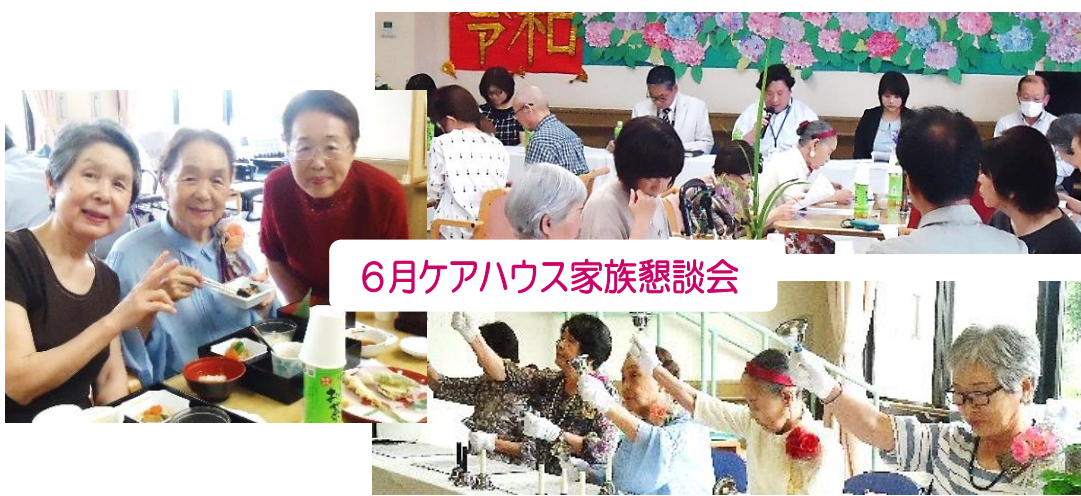
6月ケアハウス家族懇談会

施設対抗・風船バレー(特養従来) 6月9日は、ひまわりホーム・ モモ・中の郷の市内特養三者で風 船バレー大会を催し、白熱の戦い を中の郷が制しました。選抜チー ムの皆さん大変お疲れ様でした。