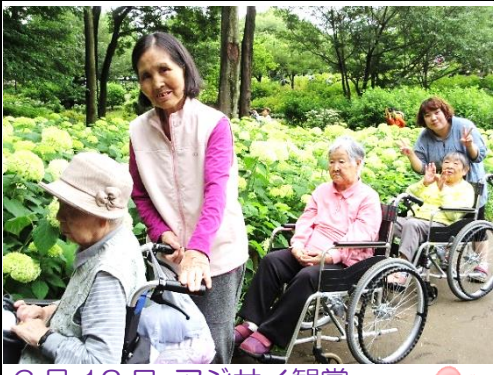
6月12日 アジサイ観賞 梅雨の合間、北公園へ行きました。 美しいアジサイに見惚れて来ました。