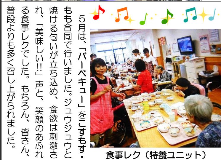
食事レク（特養ユニット）

5月は、「パーベキュー」をします。もも合同で行いました。シウウシウウと焼ける匂いが立ち込め、食欲は刺激され、「美味しい!!」声と、笑顔のあふれる食事レクでした。もちろん、皆さん、普段よりも多く召し上がられました。