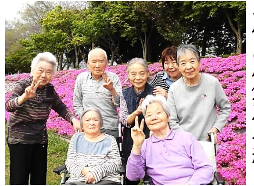
4月25日 芝桜が満開！ 暖かい日にドライブ&散策へ、 穏やかな春の陽に包まれ ピース！

「鎌倉いいなあ」利用者様のつぶやきに いざ鎌倉!? シラス丼を食べて、大仏様を拜んで、記念撮影。 念願叶い、笑顔の多い充実した一日となりました。