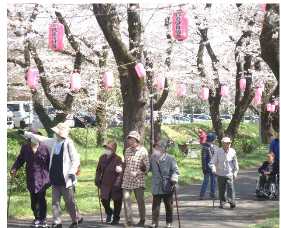
4月お花見ツアー(ケアハウス)

編集後記 熱中症が心配な季節です。 こまめに水分を補給して、涼しく過 しましょう。バランスの良い食事と、 睡眠、適度な運動も大切です。 無病息災・平穩無事 七夕に願いを込めて 発行日 令和元年7月10日